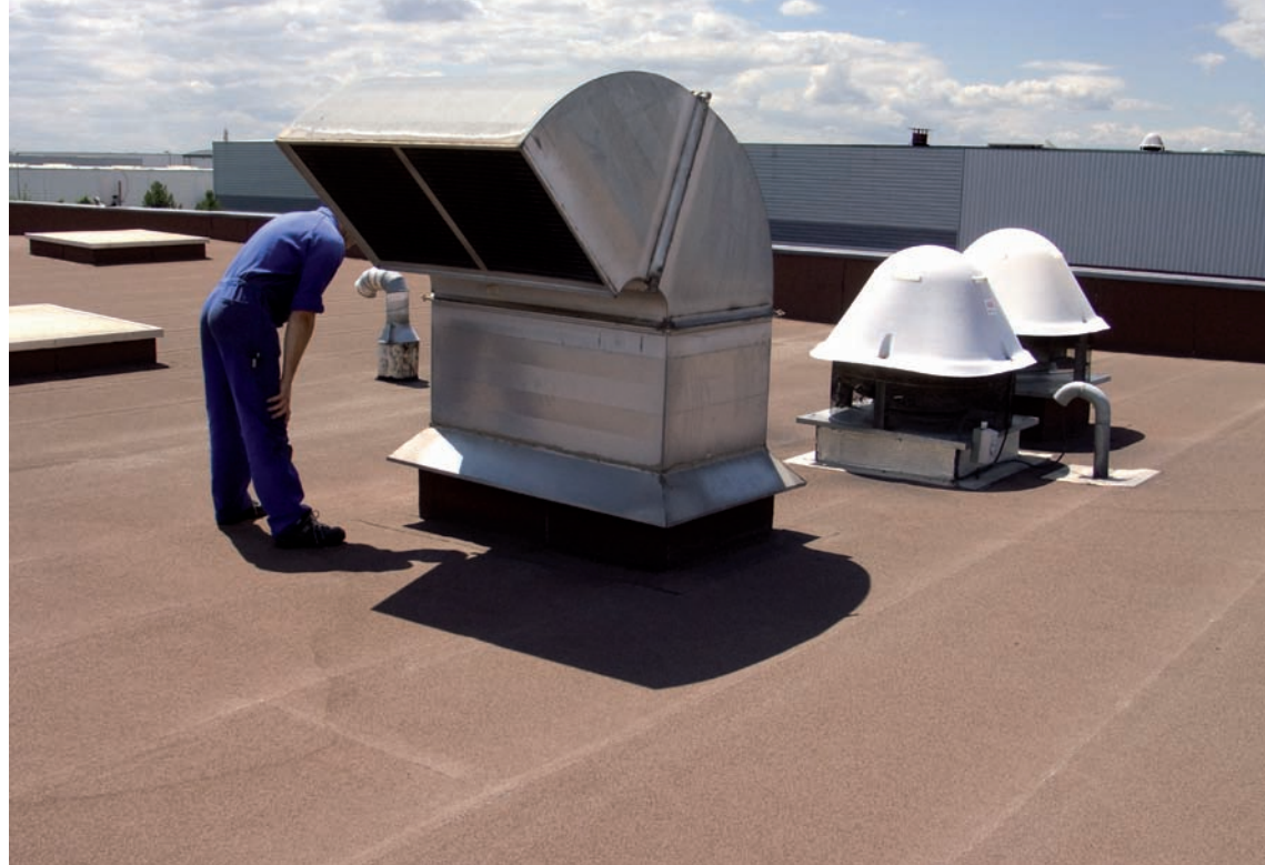
Photographie : Tu m'auras pas 123b , Fot Imprimeurs, Pusignan, 2007

Conception graphique Benjamin Lambinet pour Un Sourire de toi et j'quitte ma mère - Ne pas jeter sur la voie publique